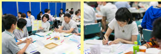
組織の課題を深掘りしながら、課題の根本を捉えるワークを行います。